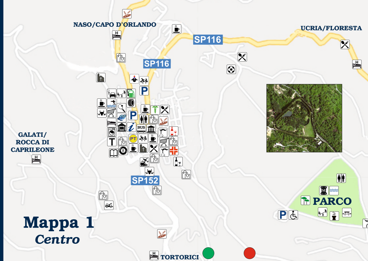
Mappa 1 Centro

"Spostandoci verso l'interno, a cinque km dal centro, troviamo contrada Sfaranda, la più popolosa di Castell'Umberto con 850 abitanti circa, con il suo fiorito Borgo Luigi, luogo di incontro fra tradizione e memoria storica... "