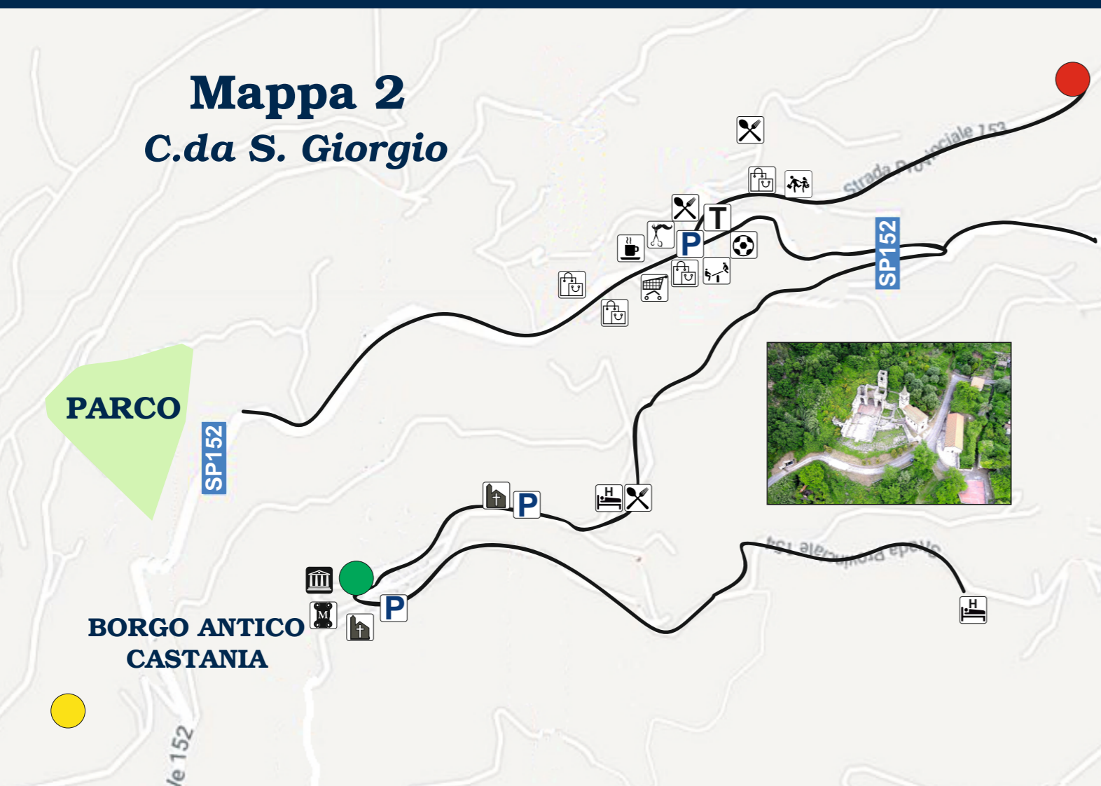
Mappa 2 C.da S. Giorgio