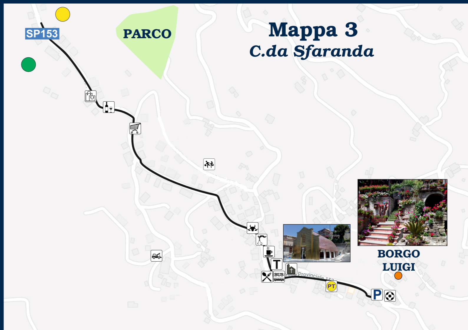
Mappa 3 C.da Sfaranda