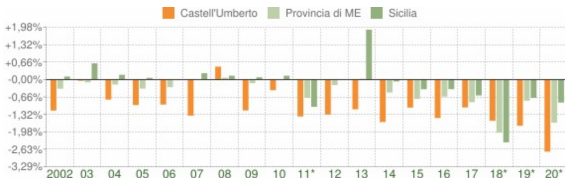
Variazione percentuale della popolazione

Le variazioni annuali della popolazione di Castell'Umberto espresse in percentuale a confronto con le variazioni della popolazione della città metropolitana di Messina e della regione Sicilia.