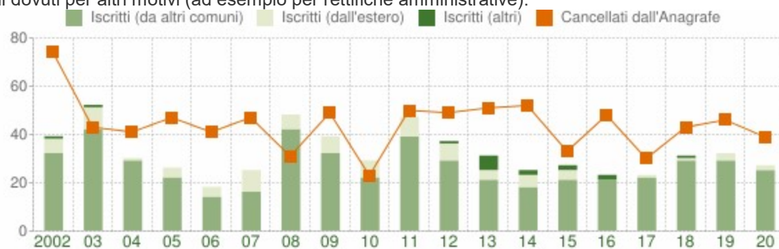
Flusso migratorio della popolazione

Fra gli iscritti, sono evidenziati con colore diverso i trasferimenti di residenza da altri comuni, quelli dall'estero e quelli dovuti per altri motivi (ad esempio per rettifiche amministrative).