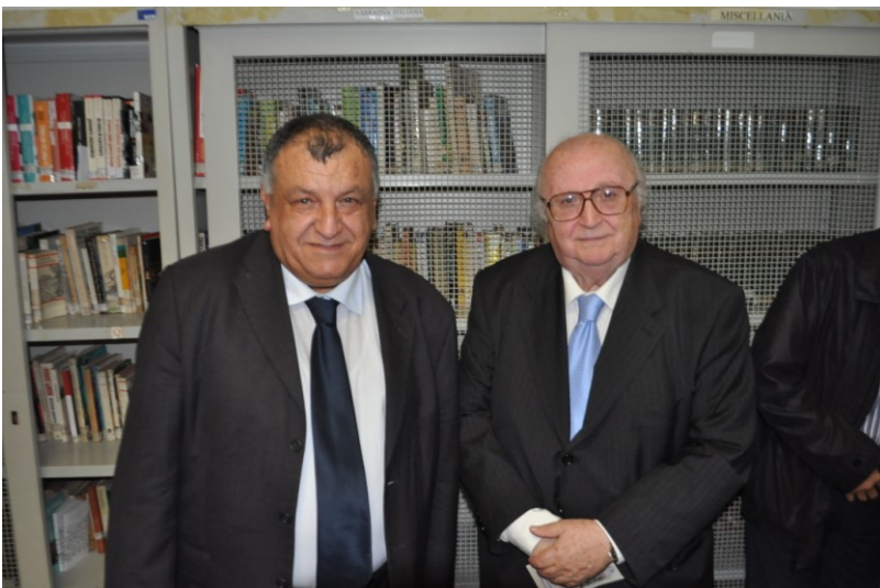
Il Sindaco con Montes