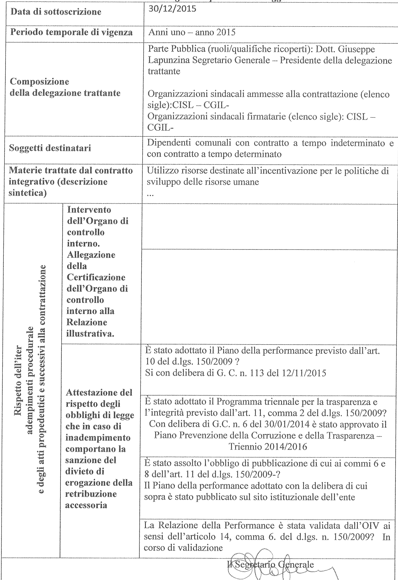
Illustrazione degli aspetti procedurali, sintesi del contenuto del contratto ed autodichiarazione relative agli adempimenti della legge