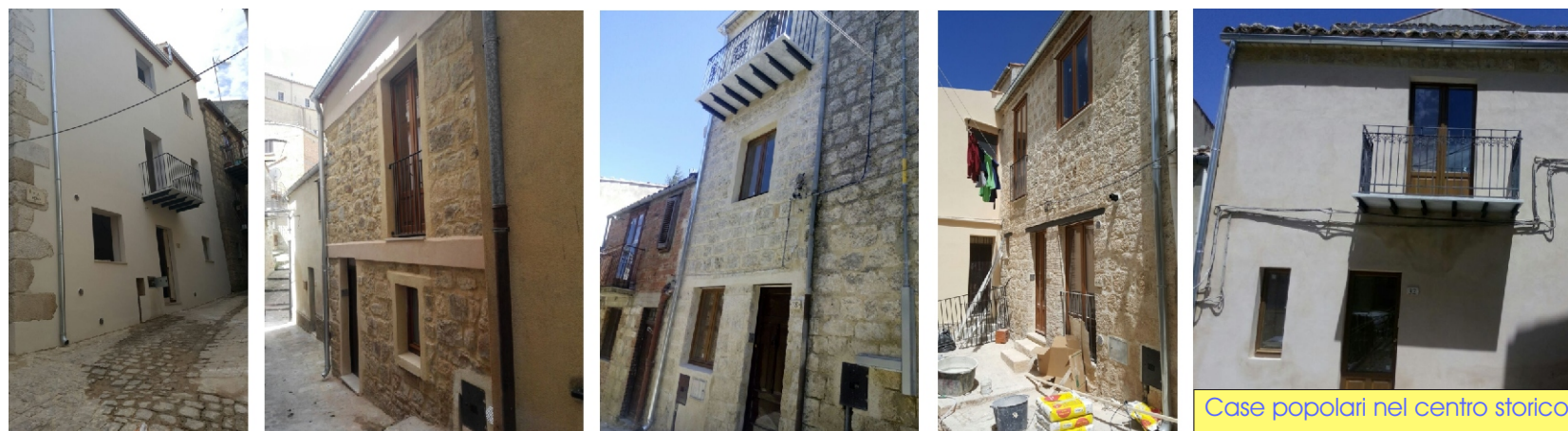
Case popolari nel centro storico

E' stato garantito il trasporto alunni fuori