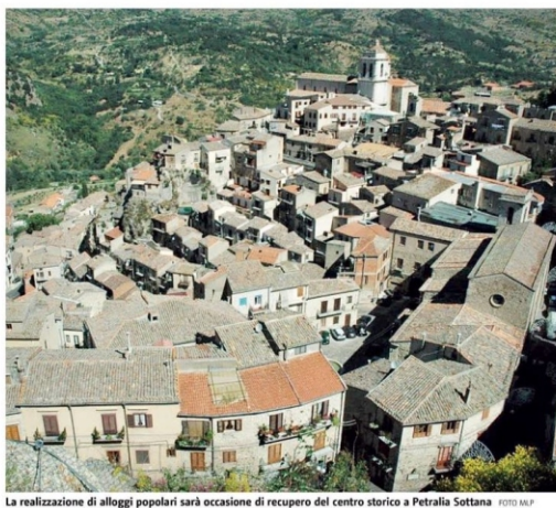
La realizzazione di alloggi popolari sarà occasione di recupero del centro storico a Petralia Sottana.

Proprio il recupero di vecchie abitazioni del centro storico e l'evitare ulteriore cementificazione è stata considerata una delle azioni più qualificanti del paese ad Eccezione-Rimini, la fiera internazionale del recupero e dello sviluppo sostenibile, che ha premiato Petralia con il «PAES di eccellenza» nella categoria dei piccoli comuni