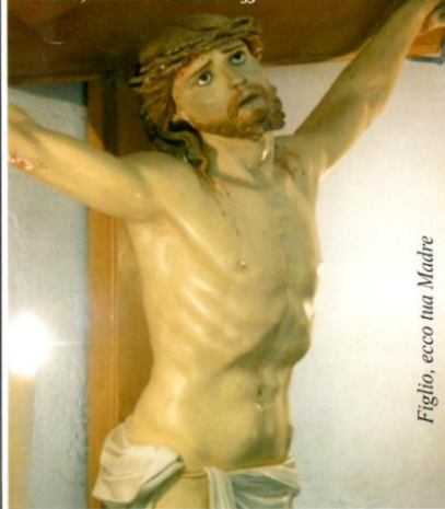
Figlio, ecco tua Madre

Padre, nelle tue mani affido la mia vita