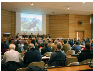
Geo & EGN/GGN

“Le rocce e gli alberi ti insegneranno cose che nessun maestro ti dirà”