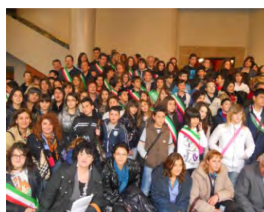
Geo & Educazione