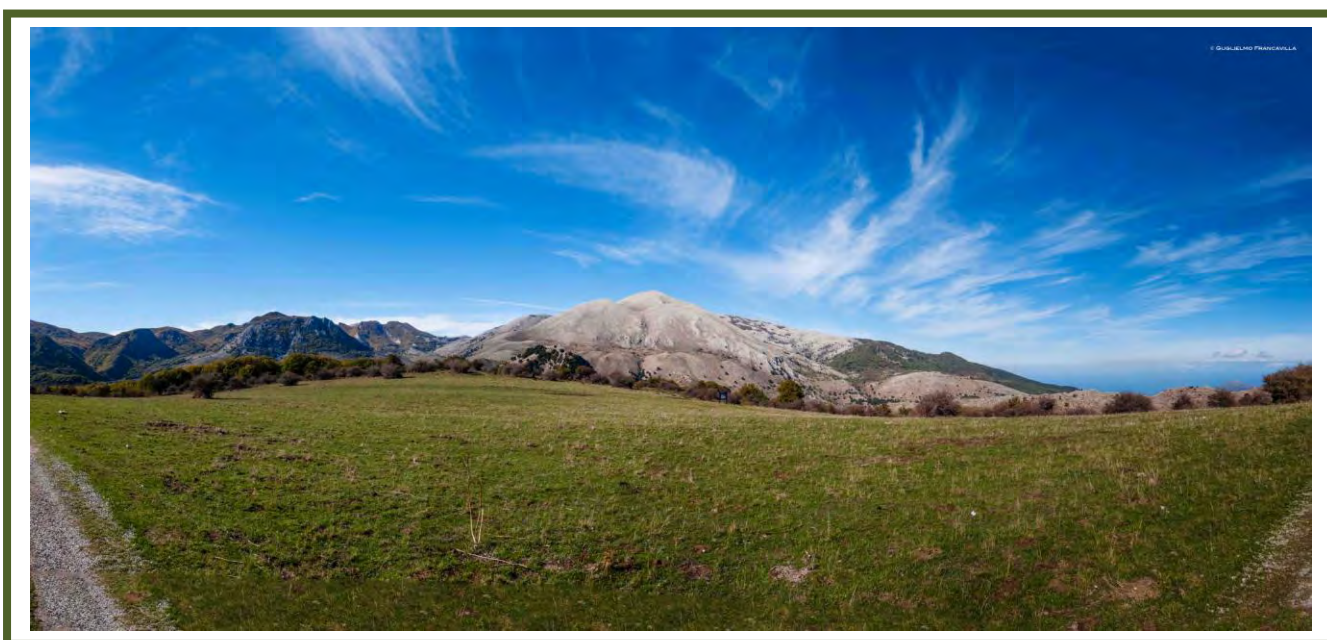
Il Parco delle Madonie, European & Global Geopark con il supporto dell'UNESCO