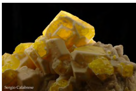
Geo & Geologia