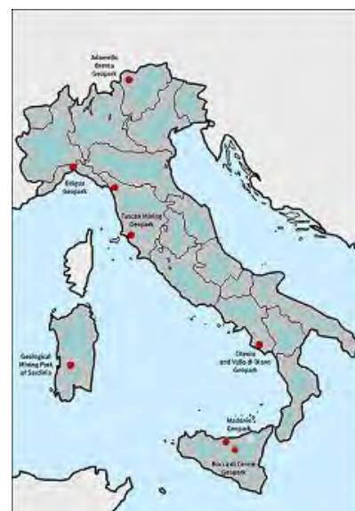
I Geoparchi in Italia