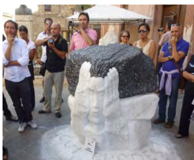
Geo & Arte