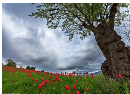
Geo & Natura