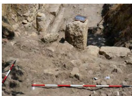
Geo & Cultura

(European & Global Geopark, con il supporto dell'UNESCO)