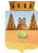
Comune di Collesano