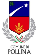
COMUNE DI POLLINA