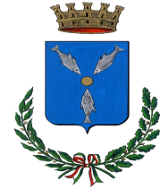
Comune di Cefalù