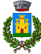
Comune di Castelbuono