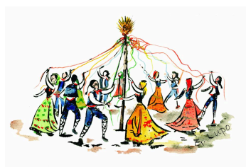
Ass. Folk. Ballo Pantomima della Cordella di Petralia Sottana