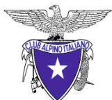
CAI MADONIE sez di Petralia Sottana