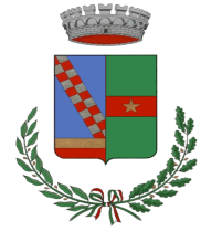
Comune di San Mauro Castelverde